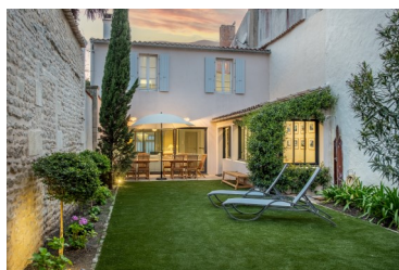
LA VILLA BARONNIE