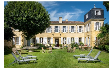
L'HÔTEL ET SES JARDINS

LA BARONNIE HÔTEL & SPA**** VOUS OUVRE LES PORTES DE SON UNIVERS. UNIQUE PAR SON AUTHENTICITÉ, L'HÔTEL RÉUNIT LA DEMEURE DU SEIGNEUR DE RÉ ET SA MAISON D'ARMATEUR DU XVIIIÈME SIÈCLE AVEC LEURS JARDINS CLOS, TERRASSES ET COURS INTÉRIEURES. LA VILLA BARONNIE, MITOYENNE ET INDÉPENDANTE, COMPLÈTE CET ENSEMBLE HÔTELIER. DANS L'ATMOSPHÈRE FEUTRÉE DE SES VASTES CHAMBRES, DANS LA TIÉDEUR DU SPA, LES VASTES JARDINS , LA BLONDEUR DU BAR, LA BARONNIE INVITE À LA DOUCEUR DE VIVRE INSULAIRE.