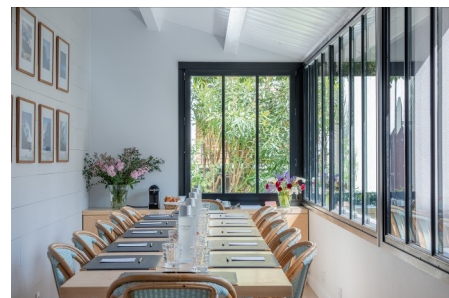
LA SALLE DE CONFÉRENCE

EN COMPLÉMENT DES PRESTATIONS DE LA JOURNÉE D'ÉTUDE, NOUS VOUS PROPOSONS DES CHAMBRES SUPPLÉMENTAIRES À L'HÔTEL LA BARONNIE MITOYEN ET AU CHOIX D'ÊTRE CONVIVIAL DANS UN RESTAURANT DE PROXIMITÉ OU SERVICE TRAITEUR POUR UN REPAS RAPIDE.